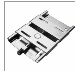
Podstawy pod silnik