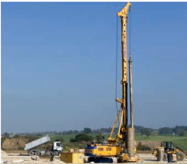
Kafar i wiertnica

Walcowa tuleja łożyska ślizgowego KS PERMAGLIDE® typu PAP ... P20 Podkładki oporowe KS PERMAGLIDE® typu PAW ... P20