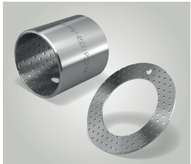
Tuleja łożyska ślizgowego KS PERMAGLIDE® P20 i podkładka oporowa P20